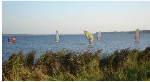
Die Kiter beim Windsurfen

Theorieinhalte und offene Fragen besprechen. Unter anderem wurde z.B. auch die Prüfung für die VDWS-Kitelizenz vorbereitet. Trotzdem mussten wir unsere Wassereinheit nicht komplett absagen: die Teilnehmer des AWH Windsurflehrerlehrgangs führten uns in die Kunst des Windsurfens ein und absolvierten so gleichzeitig eine Übung für Ihre Lehrprobe.