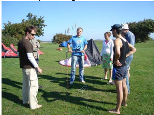
Materialkunde in Dranske

Am Donnerstag drehte der Wind wieder zurück auf Ostwind und war zum Kiten zu schwach. Also absolvierten die Prüflinge Ihre VDWS Theorieprüfung und weitere Fortgeschritteninhalte wie Halsen fahren und