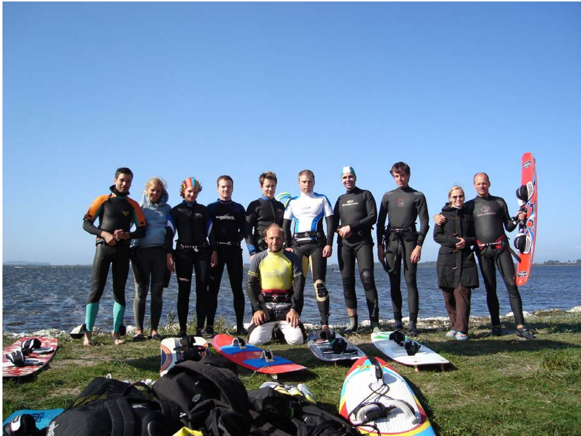
AWH Kitecamp September 2006